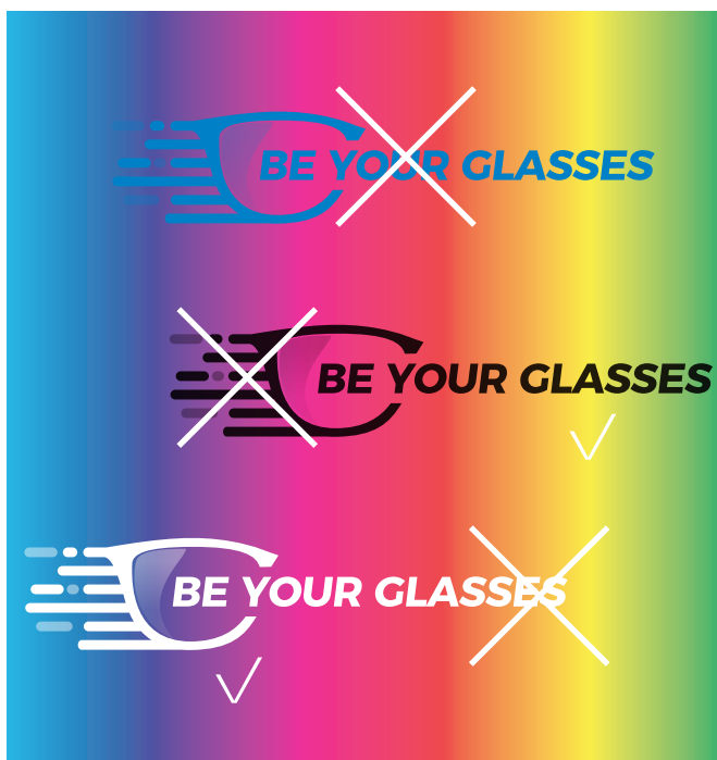
SPETTRO CROMATICO PIENO