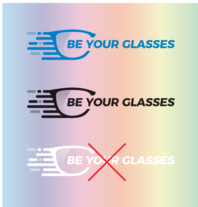
SPETTRO CROMATICO CHIARO